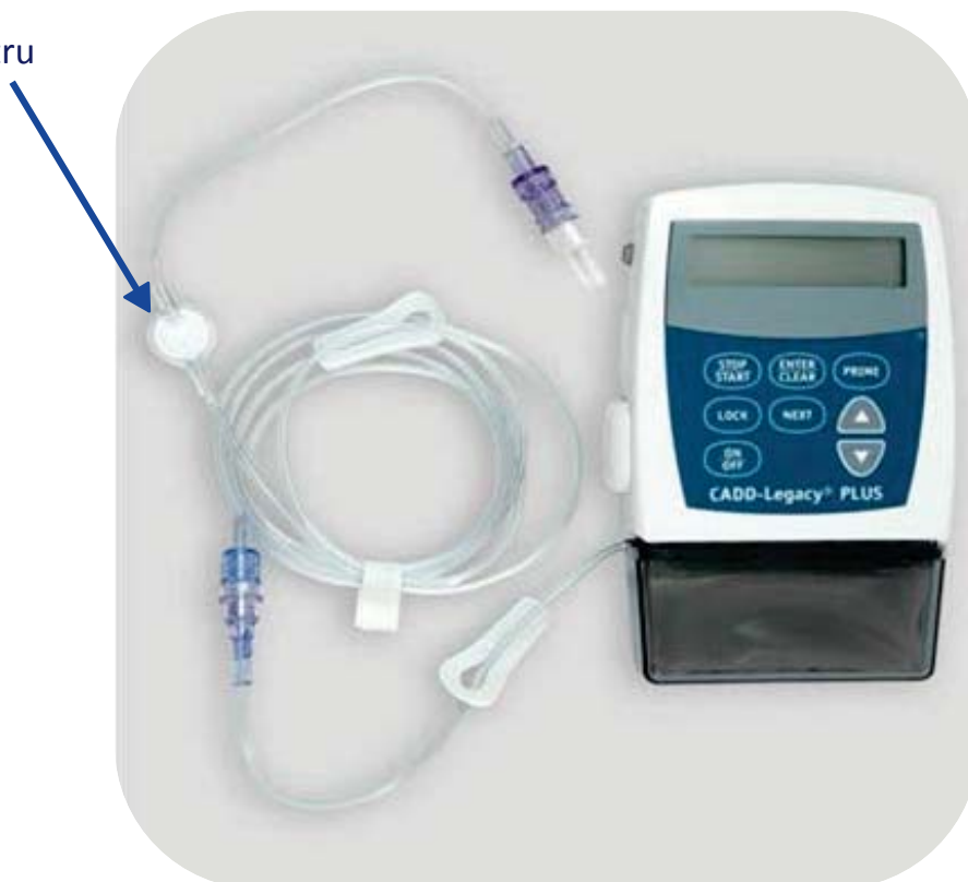
Filtr 0,2 mikrometru

Některé hadičky jsou vybaveny filtrem odstraňujícím bakterie, které se dostanou do systému. Pokud na hadičce filtr instalován není, zapojte do systému mezi pumpu a konektor filtr (s póry o velikosti 0,2 mikrometru) ze soupravy. Ten se denně (každých 24 hodin) mění současně s hadičkou a zásobníkem léku.