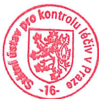
MUDr. Pavel Březovský, MBA

Dle ustanovení § 173 odst. 2 zákona č. 500/2004 Sb., správní řád, ve znění pozdějších předpisů nelze proti opatření obecné povahy podat opravný prostředek.