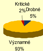
Podíl jednotlivých typů závad ZP pořízených po 1.1.2000