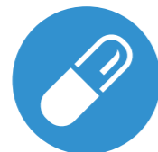
Zahájení podávání dabigatran-etexilátu 0-2 hod. před očekávaným podáním injekčního antikoagulancia