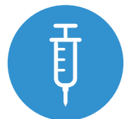
Předchozí léčba injekčním antikoagulanciem

Podávání parenterálního antikoagulačního přípravku je třeba ukončit a začít podávat dabigatran-etexilát 0–2 hodiny před časem, na který by připadala následující dávka alternativní léčby, nebo v době přerušení podávání v případě kontinuální léčby (například intravenózním nefrakcionovaným heparinem (UFH)).