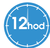
Počkat 12 hod.