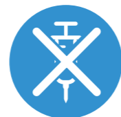
Nepodávat očekávanou dávku injekčního antikoagulancia