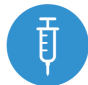
Zahájit léčbu injekčním antikoagulanciem