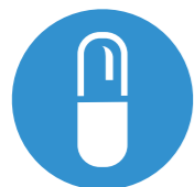
Poslední dávka dabigatran-etexilátu

S přechodem na parenterální antikoagulační léčbu se doporučuje vyčkat 12 hodin od podání poslední dávky dabigatran-etexilátu.