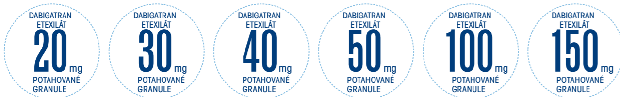
Tabulka 1: Jednotlivé a celkové denní dávky potahovaných granulí v miligramech (mg) pro pacienty mladší než 12 měsíců. Dávky u pacienta závisí na tělesné hmotnosti v kilogramech (kg) a věku v měsících.

Potahované granule dabigatran-etexilátu lze používat u dětí ve věku do 12 let, jakmile je dítě schopno polykat měkkou stravu. Doporučená dávka vychází z tělesné hmotnosti a věku pacienta, jak je uvedeno v tabulkách 1 a 2. Dávka se má v průběhu léčby upravovat podle tělesné hmotnosti a věku. Pro kombinace tělesné hmotnosti a věku, které nejsou uvedeny v dávkovacích tabulkách, nelze poskytnout žádné doporučení pro dávkování.