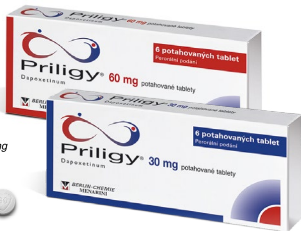
PRILIGY® 60 mg

Přípravek PRILIGY® se dodává v blistrech obsahujících 6 potahovaných tablet. Jednotlivé blistry jsou uloženy v rozkládacím obalu, společně s důležitými informacemi, s nimiž se musíte seznámit, než začnete přípravek PRILIGY® užívat. Balení je uzavřeno stříbrnou samolepící etiketou, která slouží jako záruka neporušenosti obalu. Po odstranění samolepícího uzávěru zůstává na obalu lepidlo zbytek, který má podobu šachovnice. Je-li samolepící uzávěr porušený nebo zcela chybí, přípravek neužívejte. Tablety jsou kulaté a jsou na jedné straně označeny symbolem „30“ (světle šedá tableta) nebo „60“ (šedá tableta) uvnitř trojúhelníku.