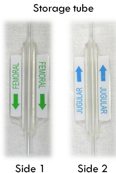
Obrázek 2- Správný tisk na úložné trubičce

Storage tube = úložná trubička Side 1 = Strana 1 Side 2 = Strana 2