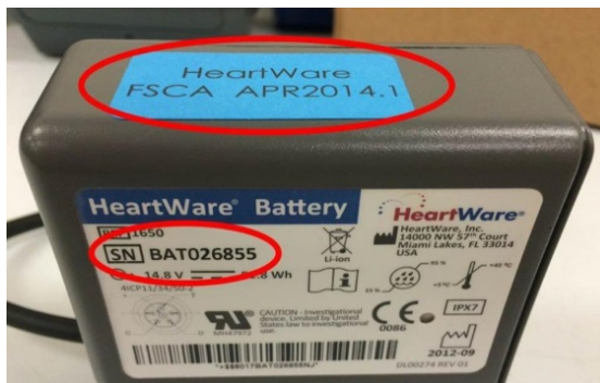
Obrázek 1: Příklad baterie HeartWare®