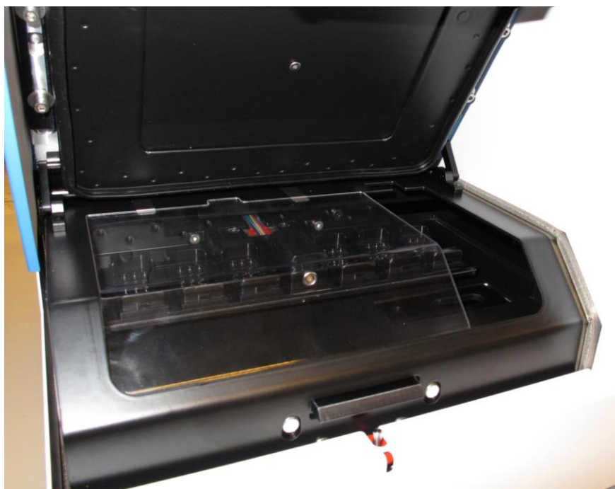
Inkubátor s časosběrným snímkováním EmbryoScope s otevřenými vkládacími dvířky a průhledným plastovým krycím panelem na správném místě