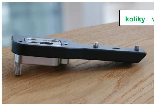
Fot. 1. Vyhovující zařízení