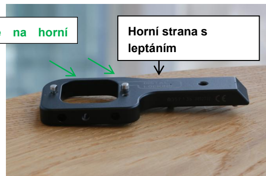
Fot. 2. Vyhovující zařízení