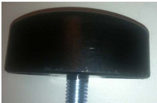
Obr. 3 Nový, bezpečnější model křídlového držadla. Závít vede do držadla.

Společnost Handicare v květnu 2011 změnila dodavatele křídlových držadel, takže křídlové držadlo má nyní konstrukci, díky níž zůstává šroub bezpečně v držadle, obr. 3, a tím udržuje západku těsně u žebříku a minimalizuje vznik vůle.