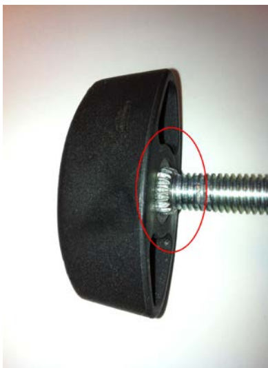
Obr. 1 Křídlová držadla pro ReTurn, kde je vidět připojení šroubu v držadle.

Křídlová držadla pro ReTurn7400 a ReTurn7500, u nichž šrouby nejsou správně vloženy do držadel – na obrázku 1 označeno červeně. Vztahuje se jen na modely ReTurn, u nichž je žebřík připojen k podvozku jako na obrázku 2 . Všechny modely ReTurn7400 a ReTurn7500 s touto konstrukcí, dodané do května 2011, mohou mít toto křídlové držadlo. Týká se také náhradních dílů „křídlová držadla“, číslo položky 7322, dodaných v období červen 2009 až červenec 2011.