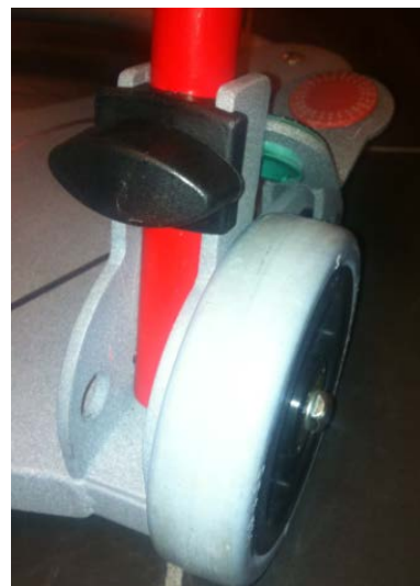
Obr. 2 Připevnění žebříku na příslušných modelech ReTurn. Křídlové držadlo, západka a žebřík.